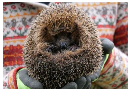
Fund im Gartenkompost.....