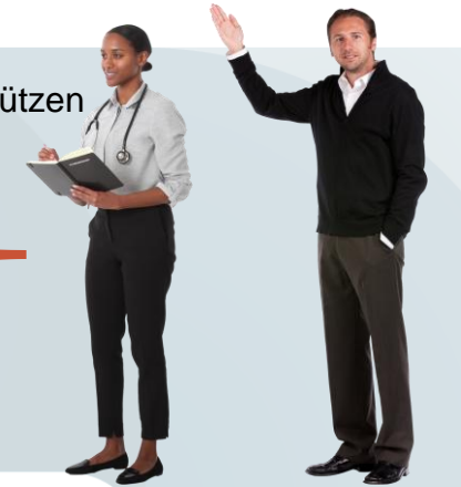
Arbeitsmediziner und FaSi