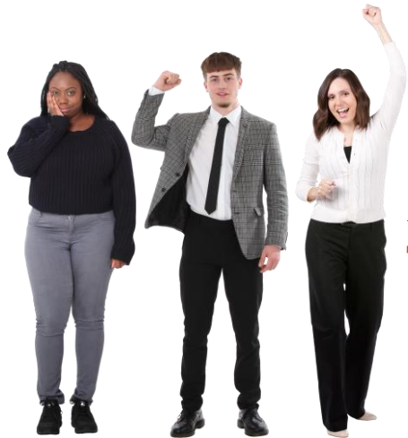
Sicherheitsbeauftragte, Betriebliche Ersthelfer, Brandschutz- und Evakuierungshelfer, ...