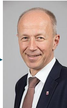
Arbeitgeber / Unternehmer

§§§ Umsetzen der von der Legislative erlassene Gesetze → Arbeitgeberpflichten